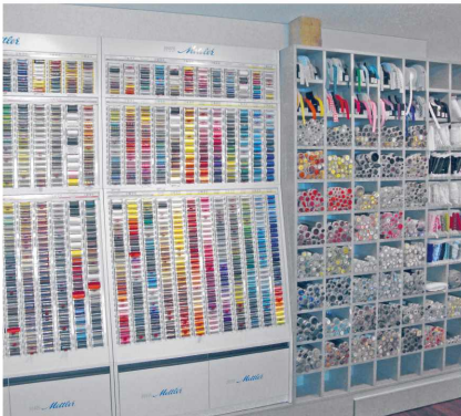
Mercerie kann gleich dazu ausgewählt werden.